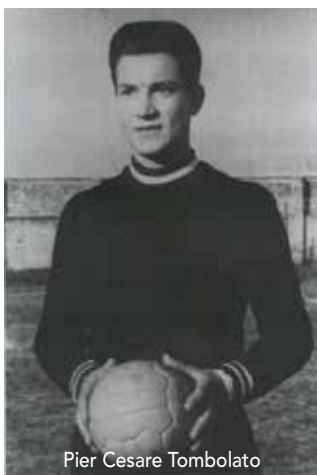
Pier Cesare Tomolato

Nel 1962 gli viene dedicato il Campo Sportivo del Patronato Pio X e il 22 agosto in suo onore viene organizzata la strabocchevole amichevole tra l'Olympia e il Milan tricolore (prossimo vincitore e prima squadra italiana ad alzare la Coppa dei Campioni nel 1963), che scese dal ritiro di Asiago guidato da capitano Cesare Maldini e Gianni Rivera. Quindi nel 1981 gli venne intitolato il nuovo attuale Stadio di Cittadella, che sostituì il vecchio "Nico D'Alvise" di Riva del Grappa (oggi piazzale/parcheeggio Villa Rina).