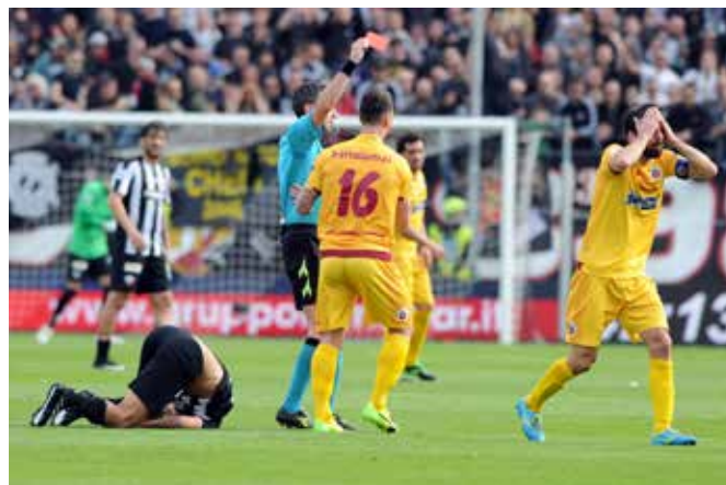
Iori espulso da Aureliano, per il capitano granata sarà il secondo stop imposto dal giudice sportivo