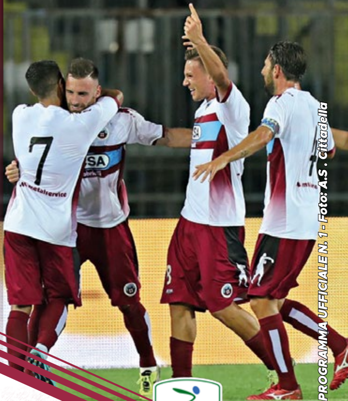
PROGRAMMA UFFICIALE N. 1

1ª GIORNATA STADIO PIER CESARE TOMBOLATO