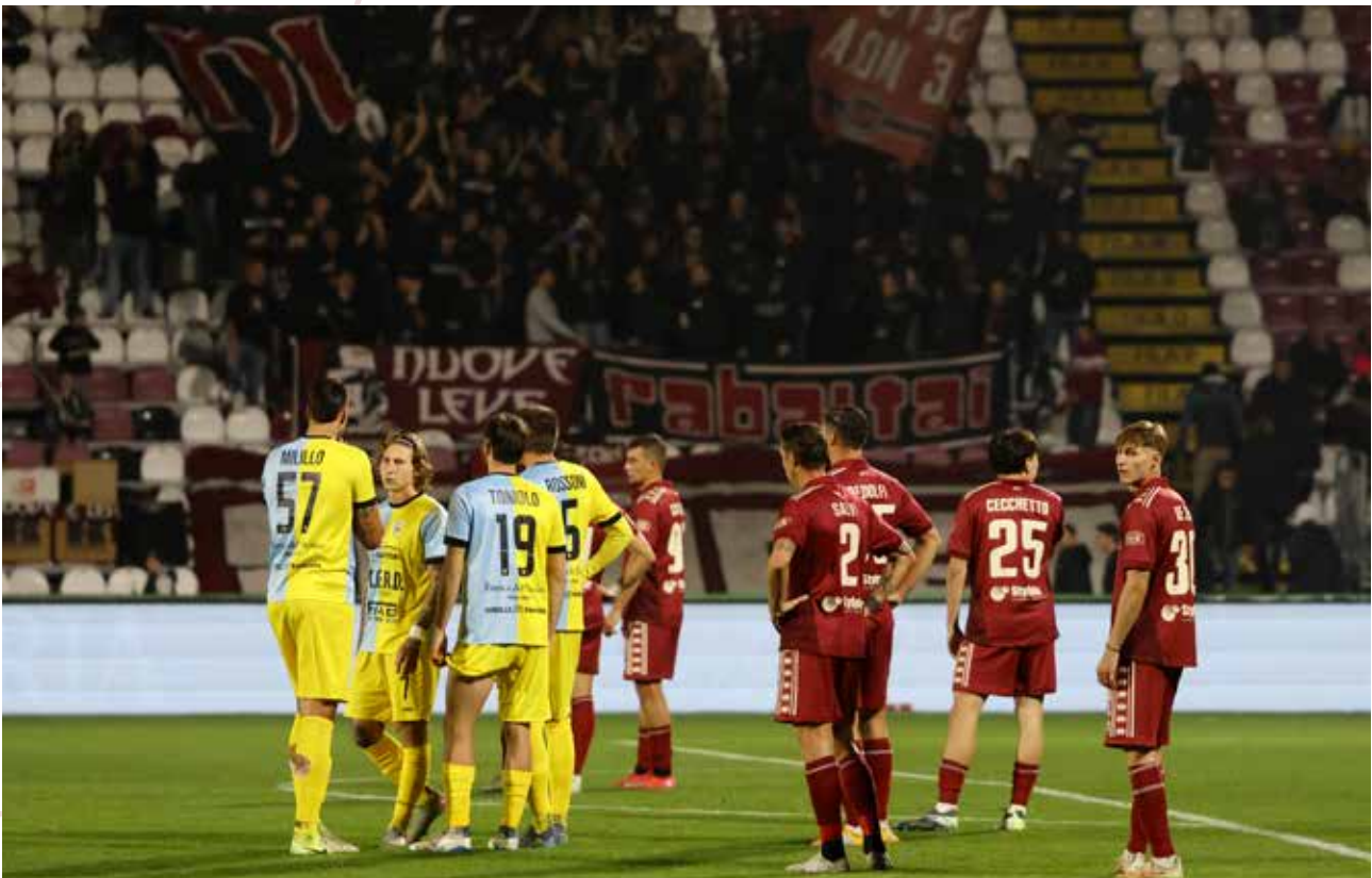
Vittoria al Tombolato e sconfitta al Dal Molin in campionato contro l'Arzignano.

avere due risultati su tre può diventare un vantaggio se la partita si mette in un certo modo, però all'inizio devi preparare la gara per cercare di portarla a casa". Al Tombolato si presenterà dunque una squadra in forma ( 6 vittorie e 4 pareggi nelle ultime 10! ) e galvanizzata dall'ingresso al fotofinish gli spareggi per la Serie B. Saranno questi gli incroci di domenica 3 maggio: Trento - Giana, Cittadella - Arzignano e Lumezzane - Alcione. Lecce che entrerà al secondo turno contro la più bassa in graduatoria delle vincenti al 1° turno, Union Brescia e Renate in gioco dai turni nazionali. Trento, granata e Lumezzane devono cercare di non perdere nei tempi regolamentari, non ci saranno infatti supplementari o rigori in caso di parità. Serviranno testa, cuore e gambe domenica in una partita da dentro o fuori.