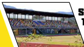
STADIO TOMMASO DAL MOLIN (1.670 posti)